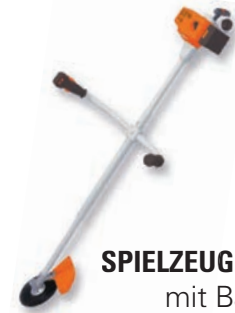
SPIELZEUGMOTORSÄGE mit Batteriebetrieb

Ab 3 Jahren, Freischneidergeräusch - Lautstärke regulierbar, Länge von 86 - 107 cm verstellbar, inklusive Batterien.