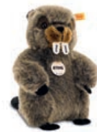
BIBER „TIM TIMBER“ by Steiff

Original Steiff Plüschtier, Sägezähne mit STIHL Logo, Gesamtgröße ca. 22 cm.