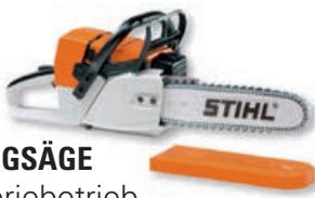
SPIELZEUGSÄGE mit Batteriebetrieb

Ab 3 Jahren, Motorsäengeräusch - Lautstärke regulierbar, umlaufende Gummikette, Gesamtlänge 40 cm, inklusive Batterien.